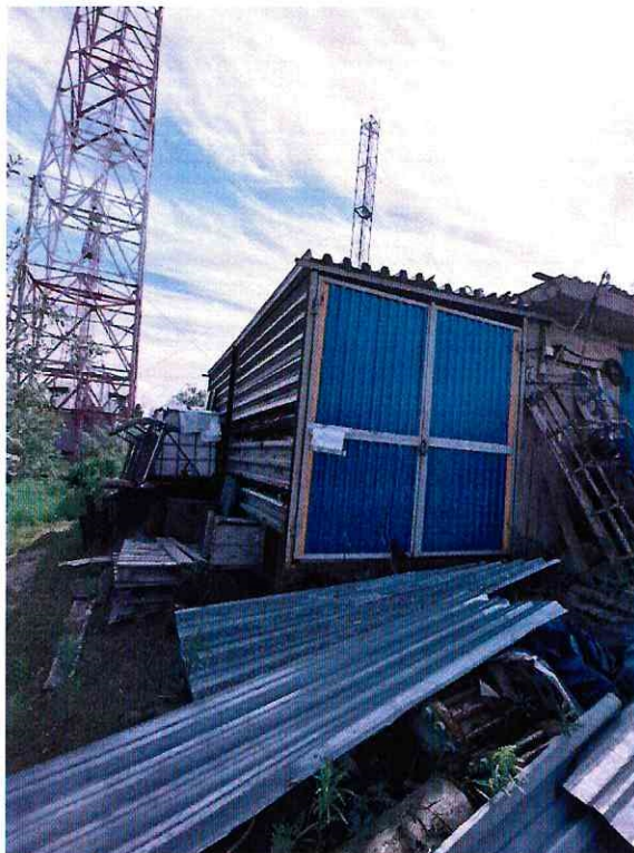
(Объект № 208 – металлическая хозяйственная постройка.)