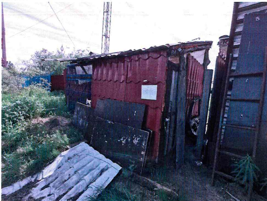
(Объект № 209 – вольер для собаки.)