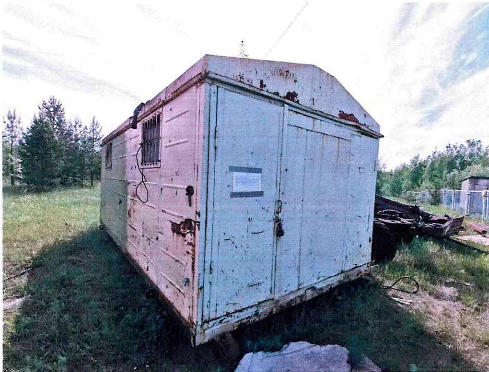
(Объект № 211– металлический вагон.)

Подпись должностного лица, составившего фототаблицу _____