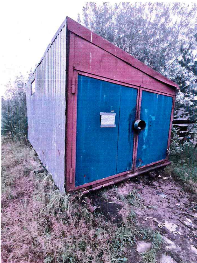
(Объект № 247 – металлический вагон-гараж на железных санях.)