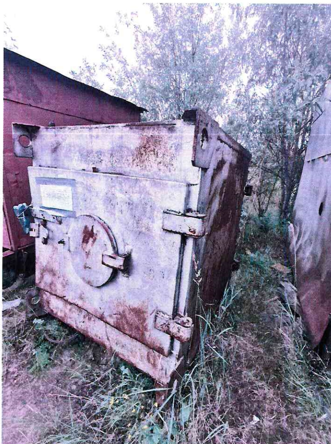
(Объект № 241 – железный контейнер.)