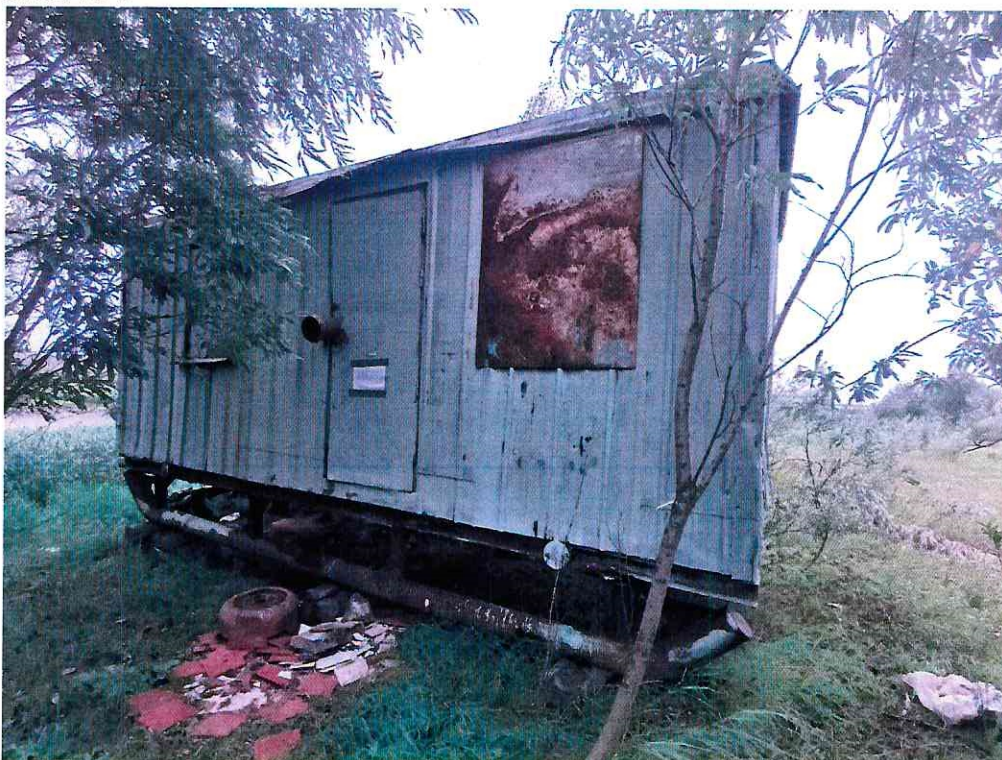
(Объект № 237 – металлический вагон на железных санях.)