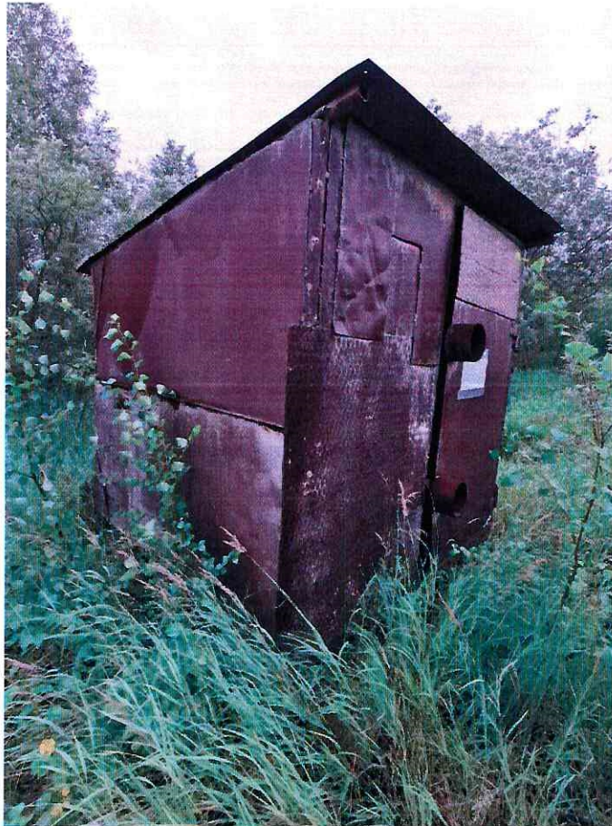
(Объект № 259 – железный контейнер.)