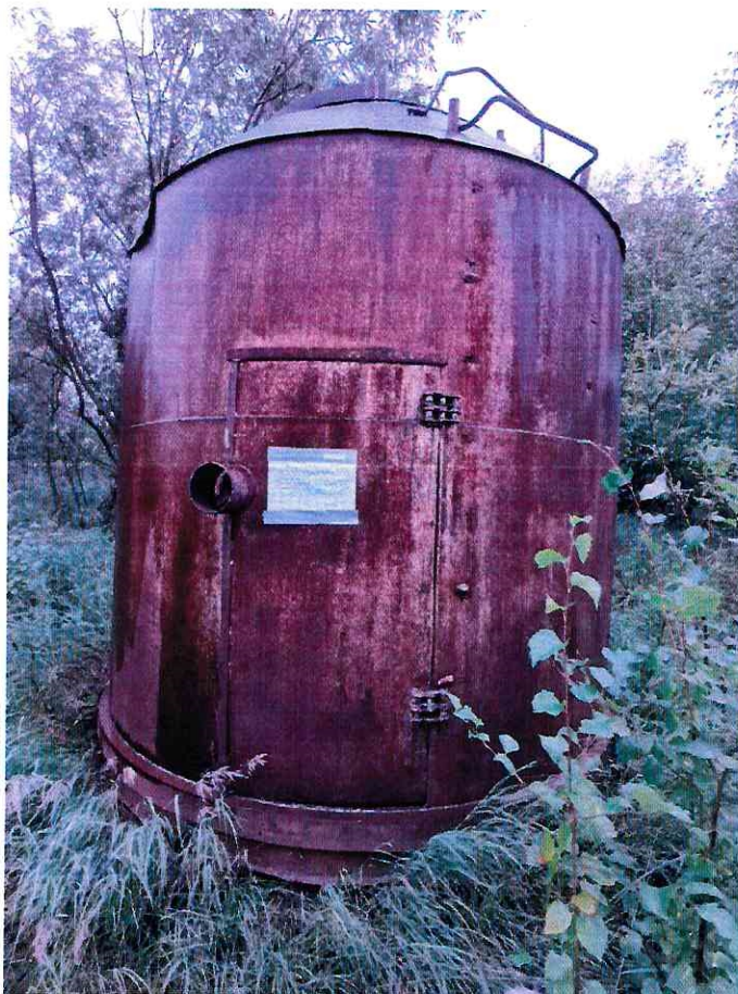
(Объект № 257 – железная бочка.)