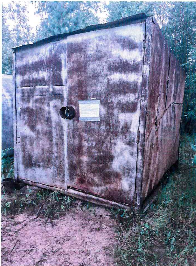
(Объект № 252 – металлический вагон-гараж на железных санях.)