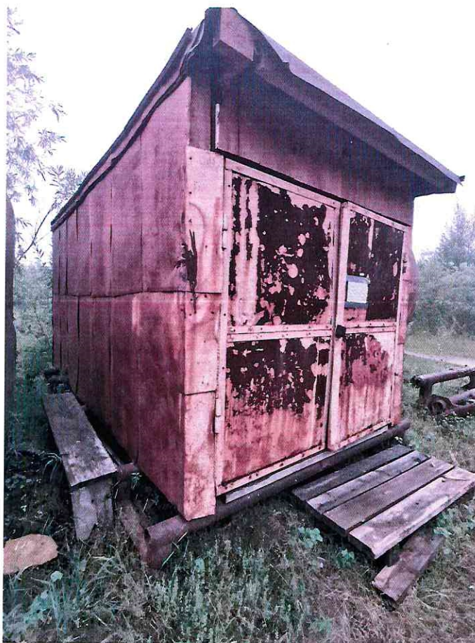
(Объект № 239 – металлический вагон-гараж на железных санях.)