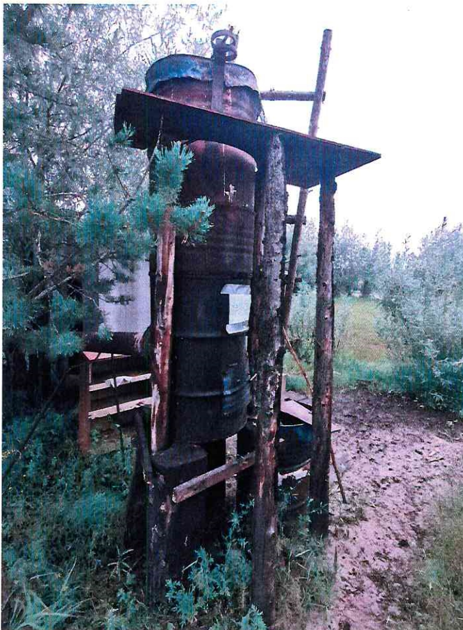
(Объект № 246 – самодельная металлическая коптильня.)