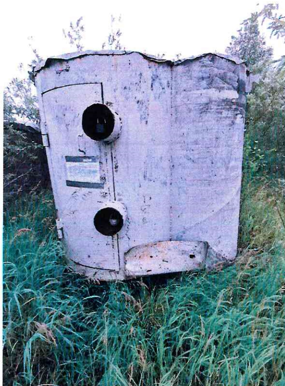
(Объект № 260 – железная бочка.)