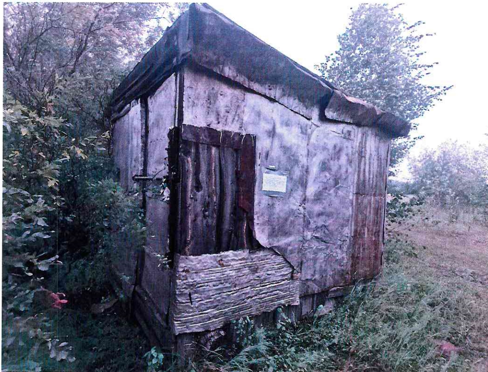
(Объект № 236 – деревянная хозяйственная постройка.)