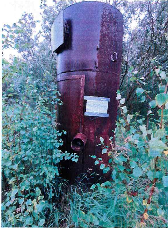
(Объект № 258 – железная бочка.)