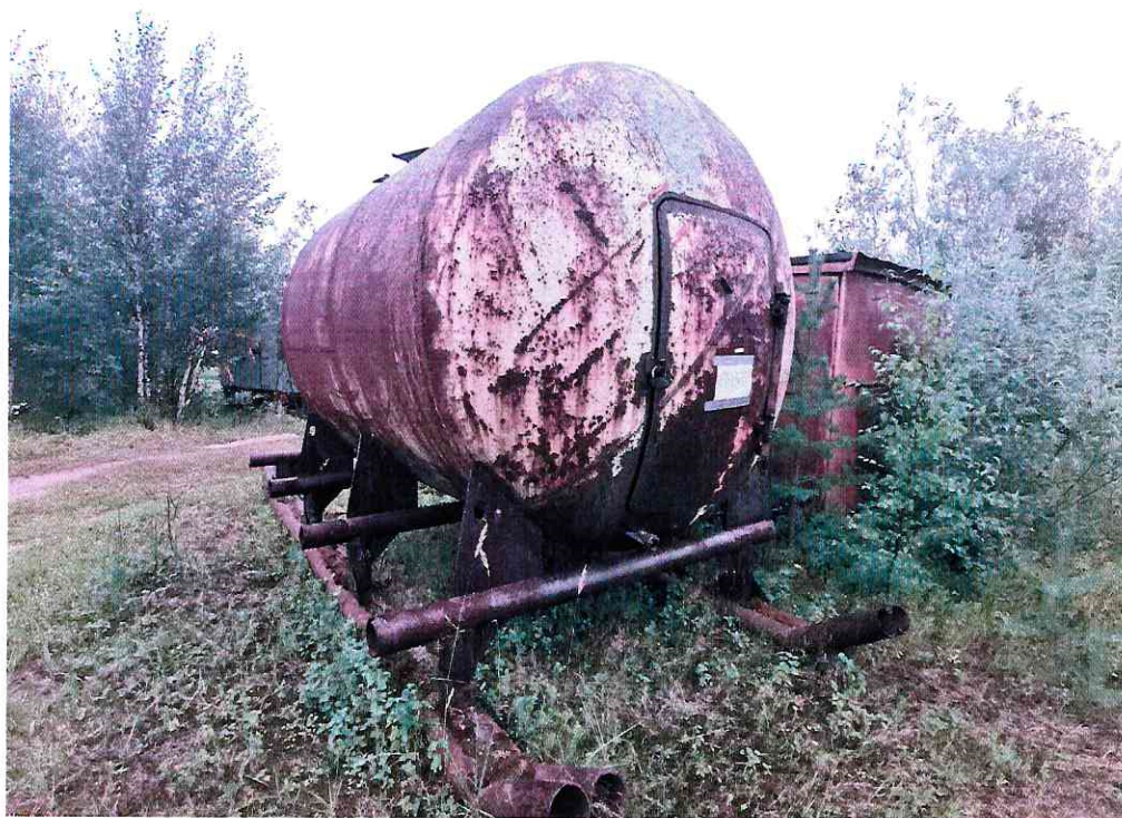
(Объект № 238 – железная бочка на железных санях.)