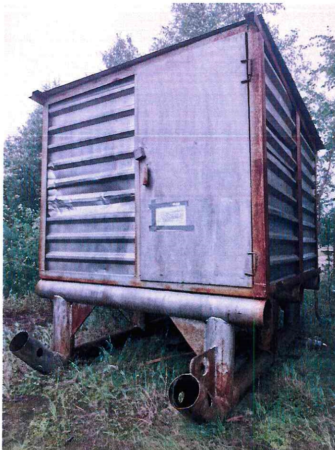
(Объект № 255 – металлический контейнер на железных санях.)