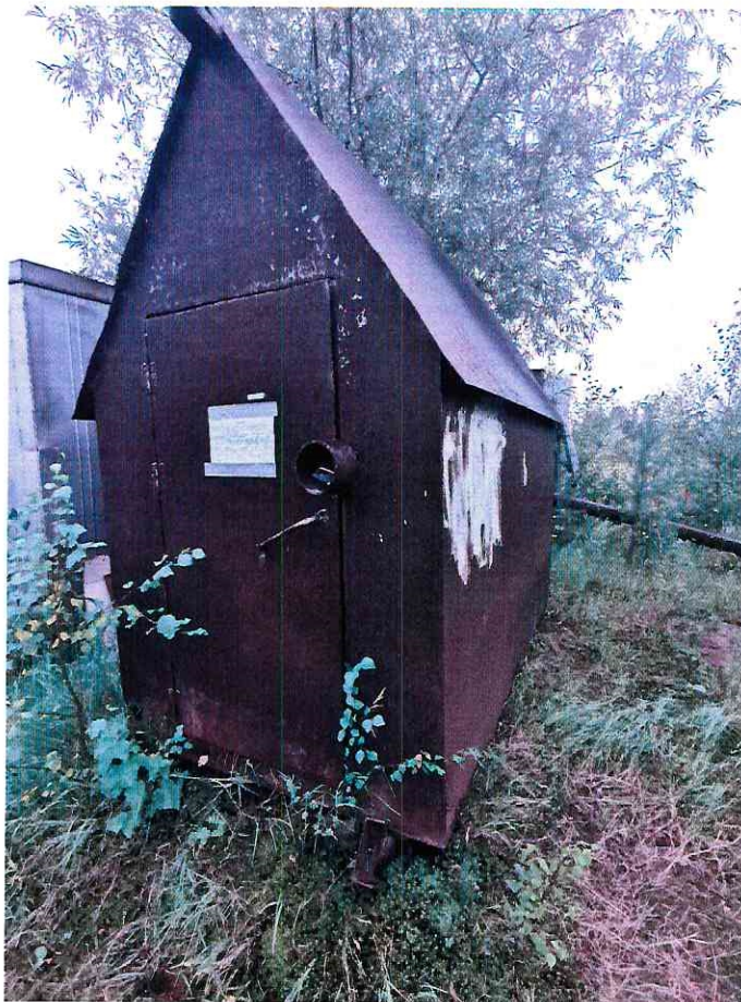
(Объект № 244 – железный балок на железных санях.)