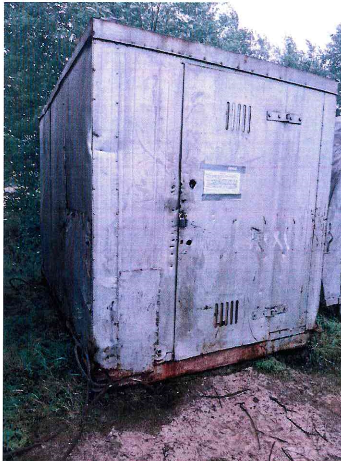
(Объект № 254 – металлический контейнер.)