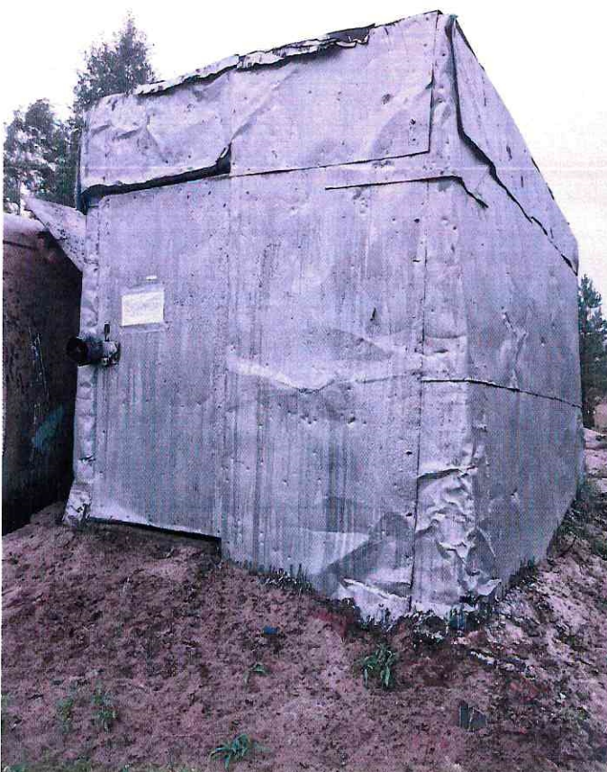
(Объект № 249 – металлический вагон-гараж на железных санях.)