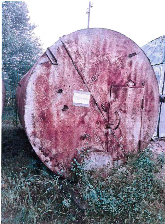
(Объект № 250 – железная бочка.)