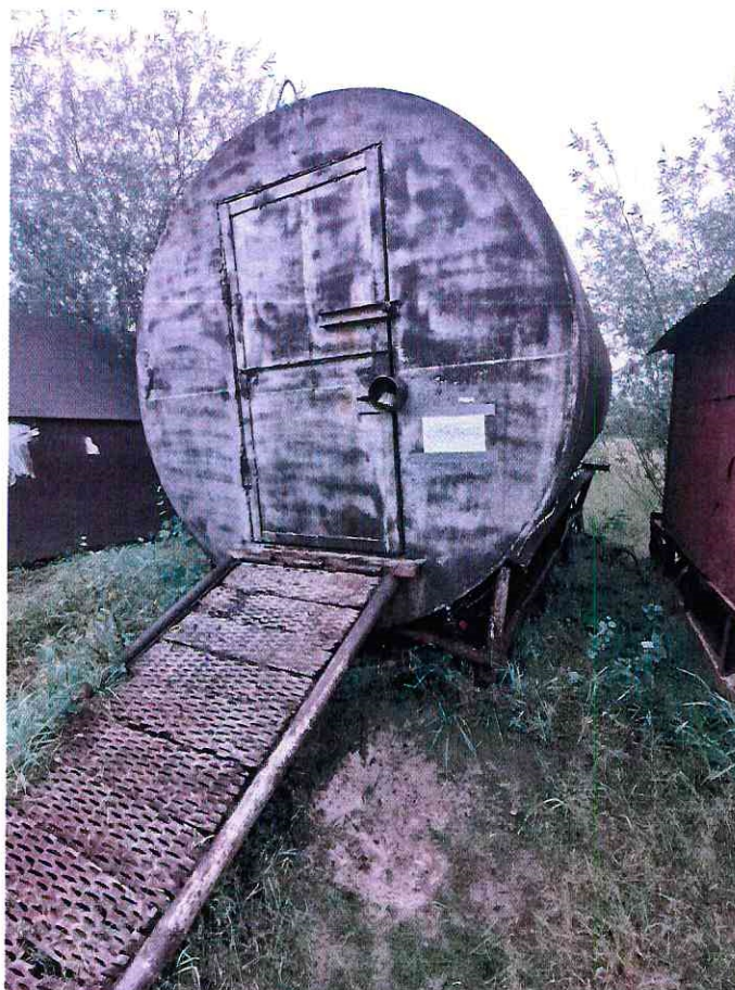
(Объект № 243 – железная бочка на железных санях.)