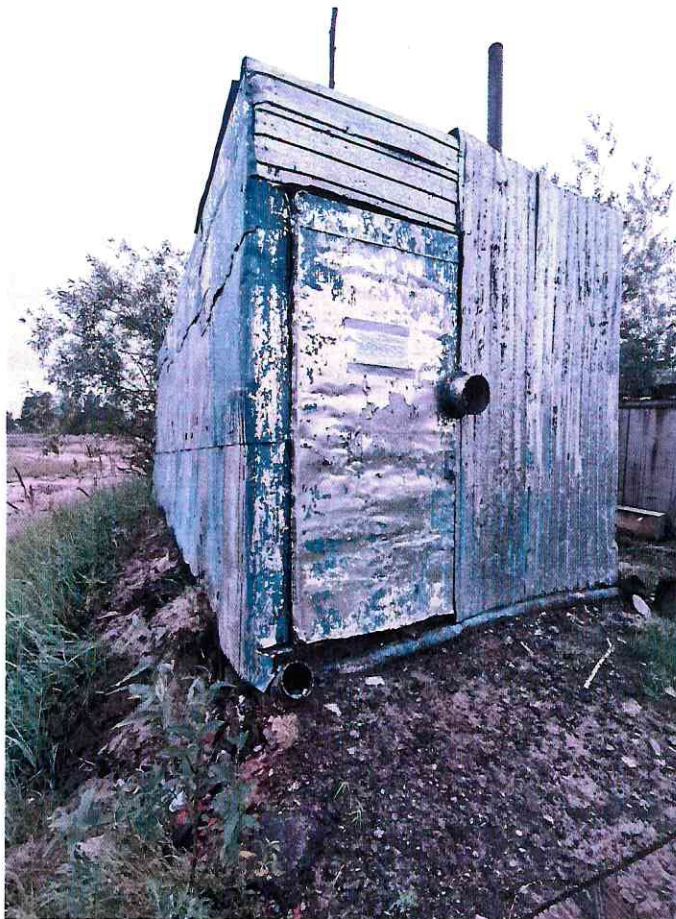
(Объект № 248 – металлический вагон-гараж на железных санях.)