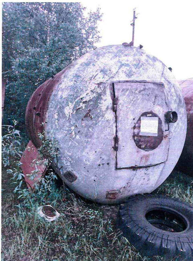
(Объект № 251 – железная бочка.)