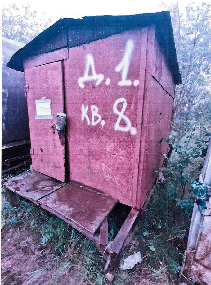
(Объект № 242 – металлический контейнер на железных санях.)