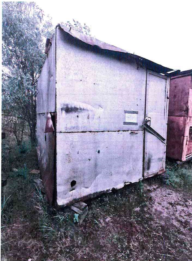
(Объект № 240 – металлический контейнер.)