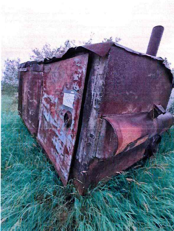
(Объект № 261 – металлический вагон на железных санях.)

Подпись должностного лица, составившего фототаблицу _____