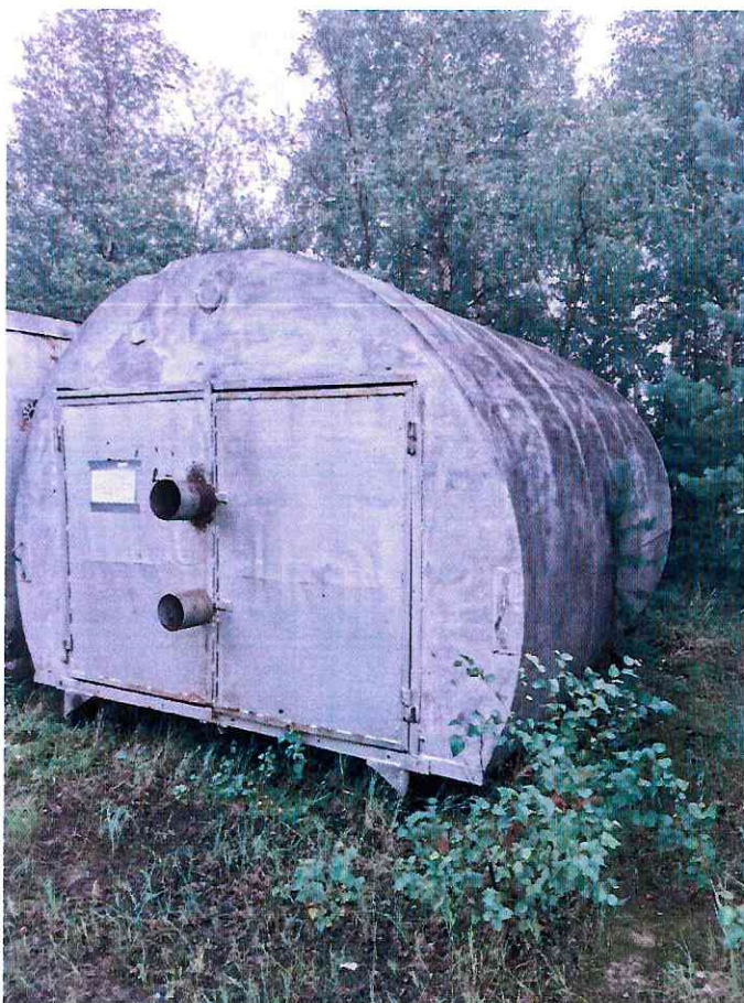
(Объект № 253 – железная бочка-гараж на железных санях.)