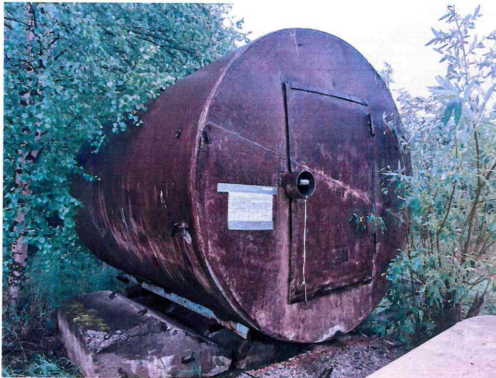
(Объект № 256 – железная бочка.)