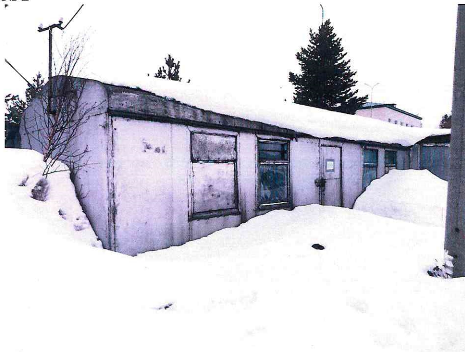
(Объект № 83. Металлический вагон.)

Подпись должностного лица, составившего фототаблицу _____