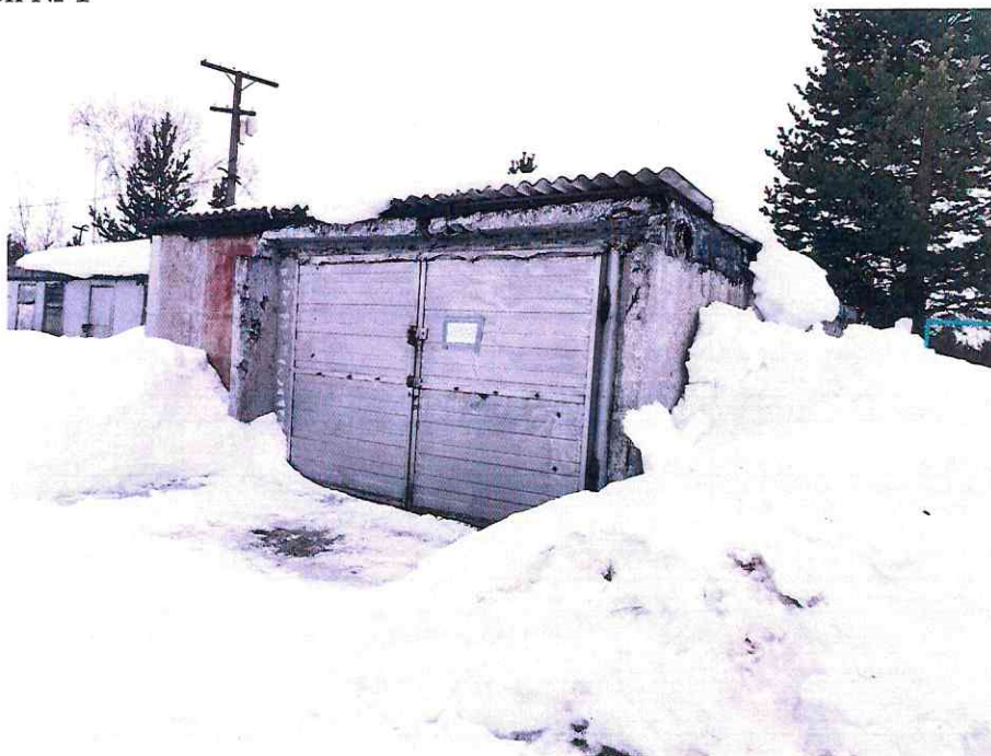
(Объект № 82. Гараж.)