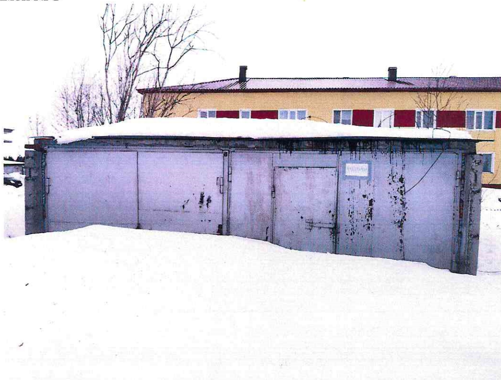
(Объект № 86. Гараж.)