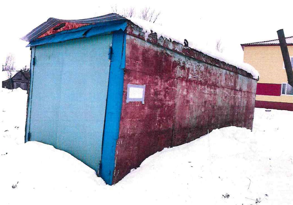
(Объект № 85. Металлический вагон-гараж. )