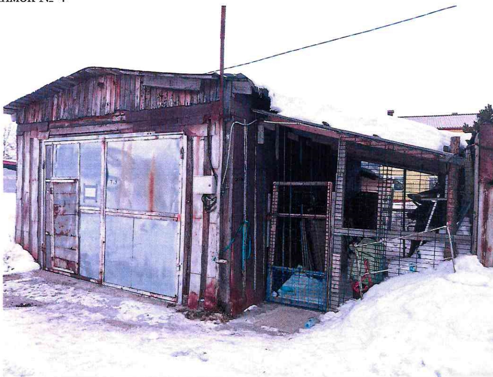
(Объект № 87. Деревянный гараж с вольером для собак.)