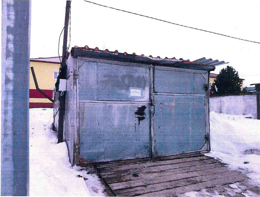
(Объект № 84. Гараж. )