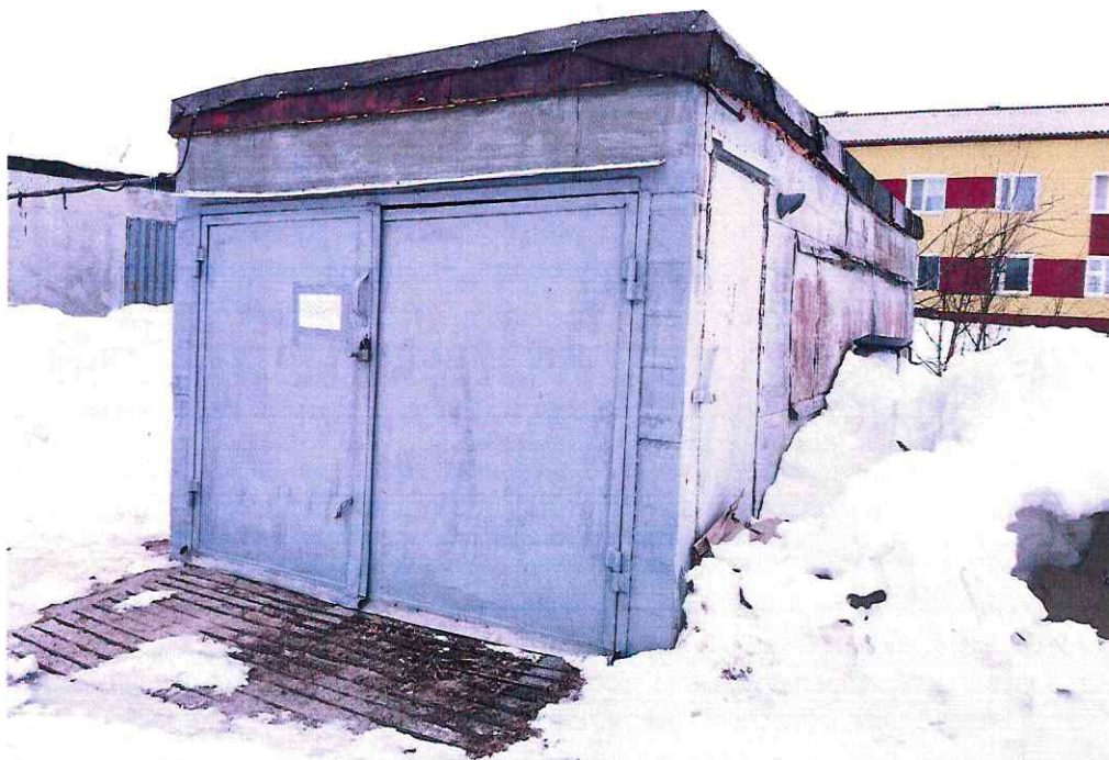
(Объект № 90. Металлический гараж.)

Подпись должностного лица, составившего фототаблицу _____