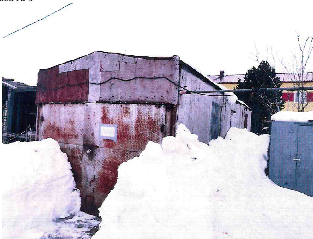
(Объект № 88. Металлический вагон-гараж.)