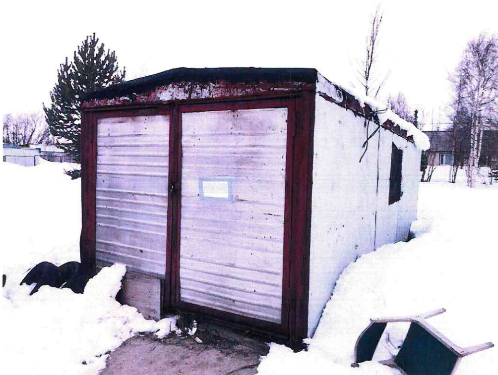
(Объект № 81. Металлический вагон-гараж)

Подпись должностного лица, составившего фототаблицу _____