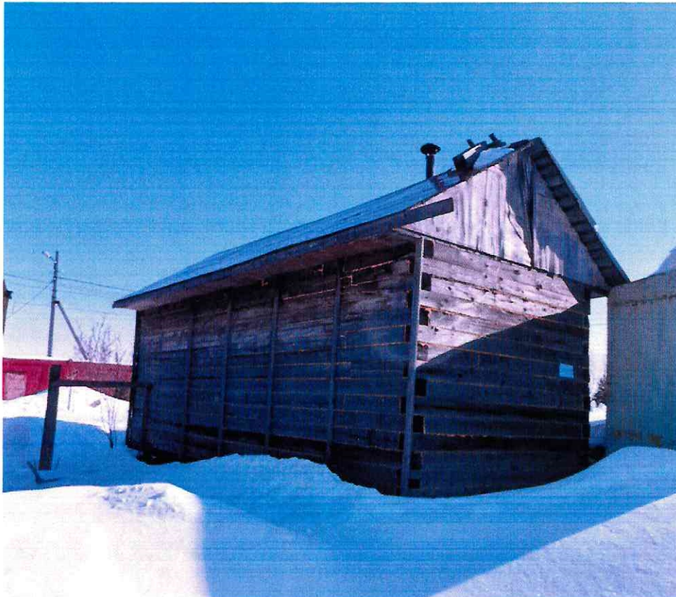
(Объект № 94. Деревянная баня.)

Подпись должностного лица, составившего фототаблицу _____