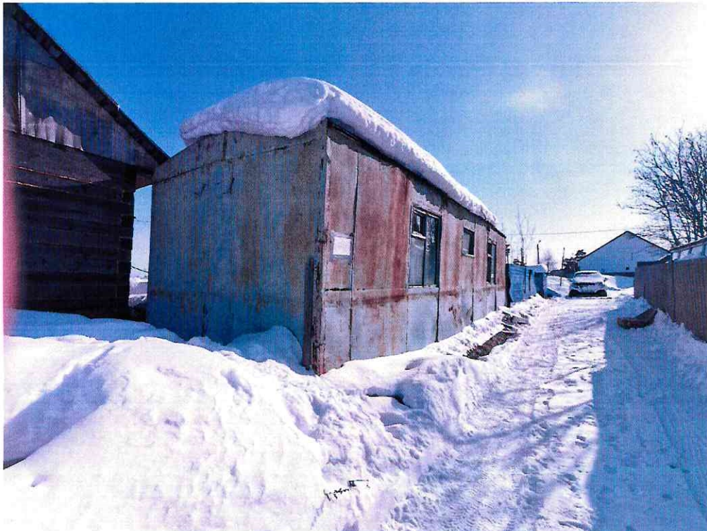
(Объект № 93. Металлический вагон.)