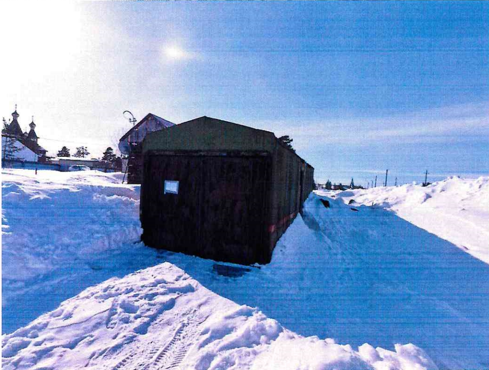
(Объект № 92. Металлический вагон-гараж.)