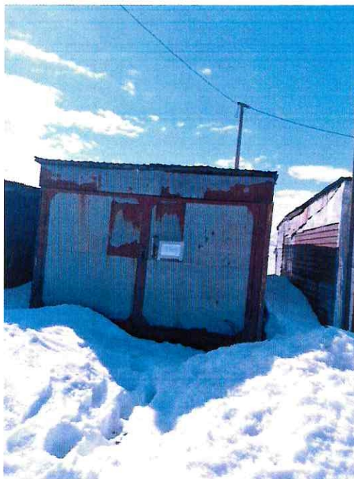
(Объект № 97. Металлический гараж.)

Подпись должностного лица, составившего фототаблицу _____