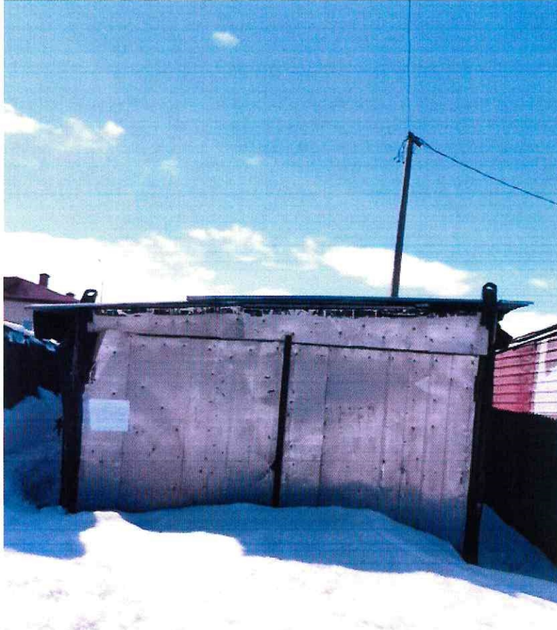
( Объект № 98. Металлический гараж. )

Подпись должностного лица, составившего фототаблицу _____