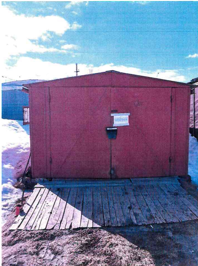
(Объект № 107. Металлический гараж.)

Подпись должностного лица, составившего фототаблицу _____