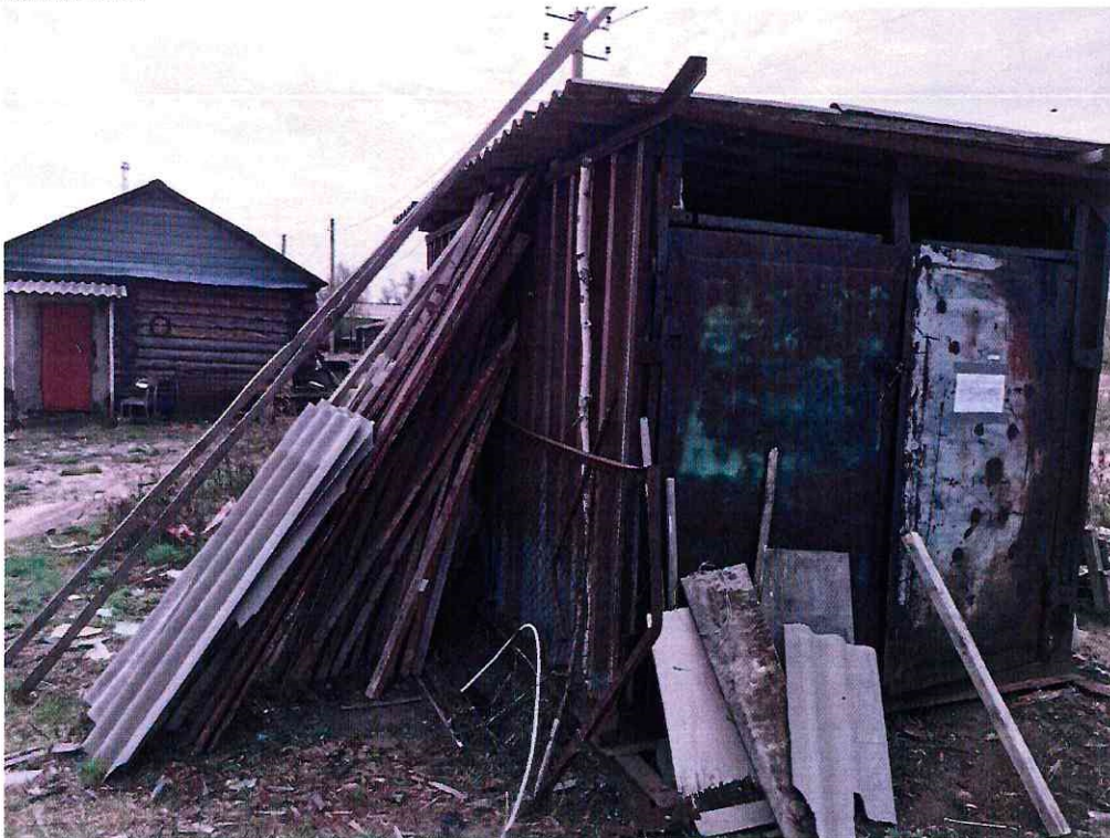
(Объект № 129 – металлический контейнер.)