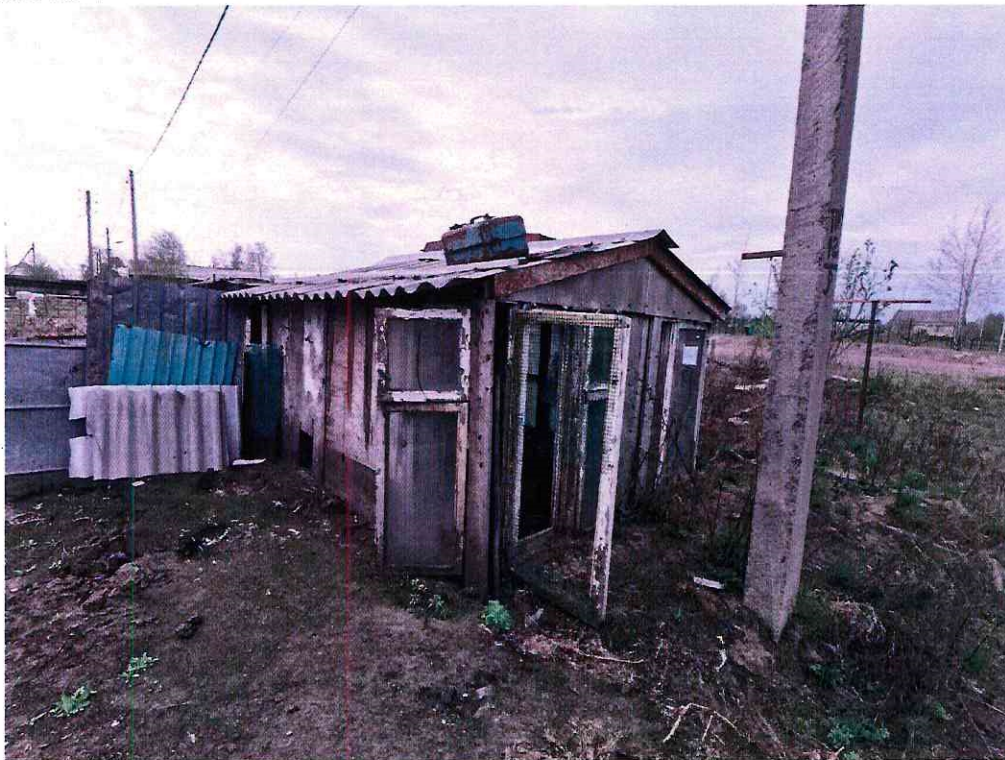
(Объект № 131 – деревянный курятник.)