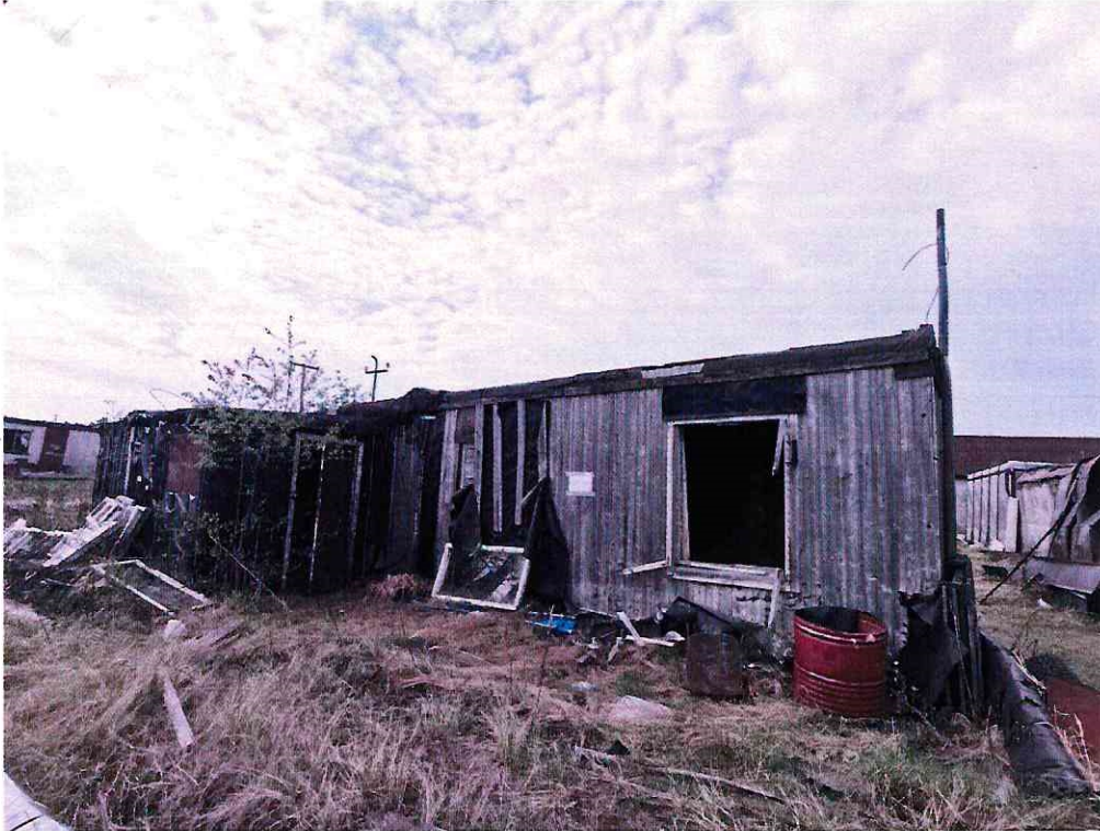
(Объект № 128 – деревянное строение.)