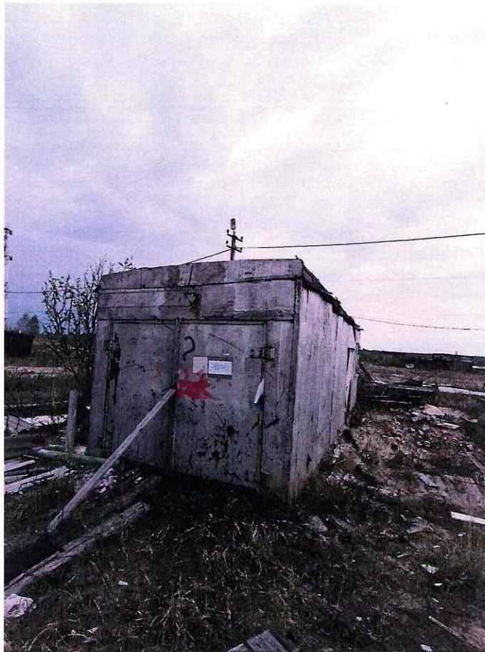
(Объект № 132 – металлический вагон.)