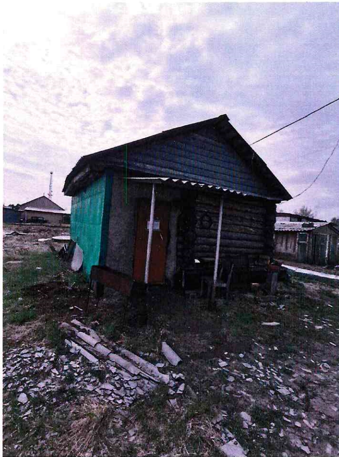
(Объект № 130 – деревянная баня.)