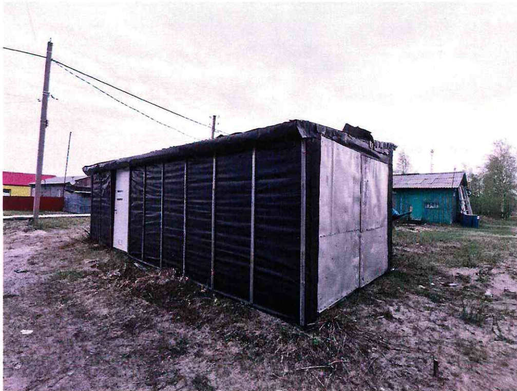
(Объект № 134 – деревянный гараж.)