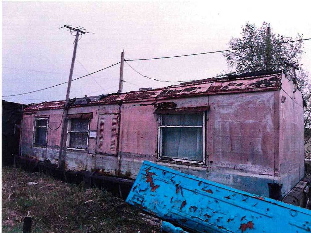
(Объект № 135– металлический вагон.)

Подпись должностного лица, составившего фототаблицу _____