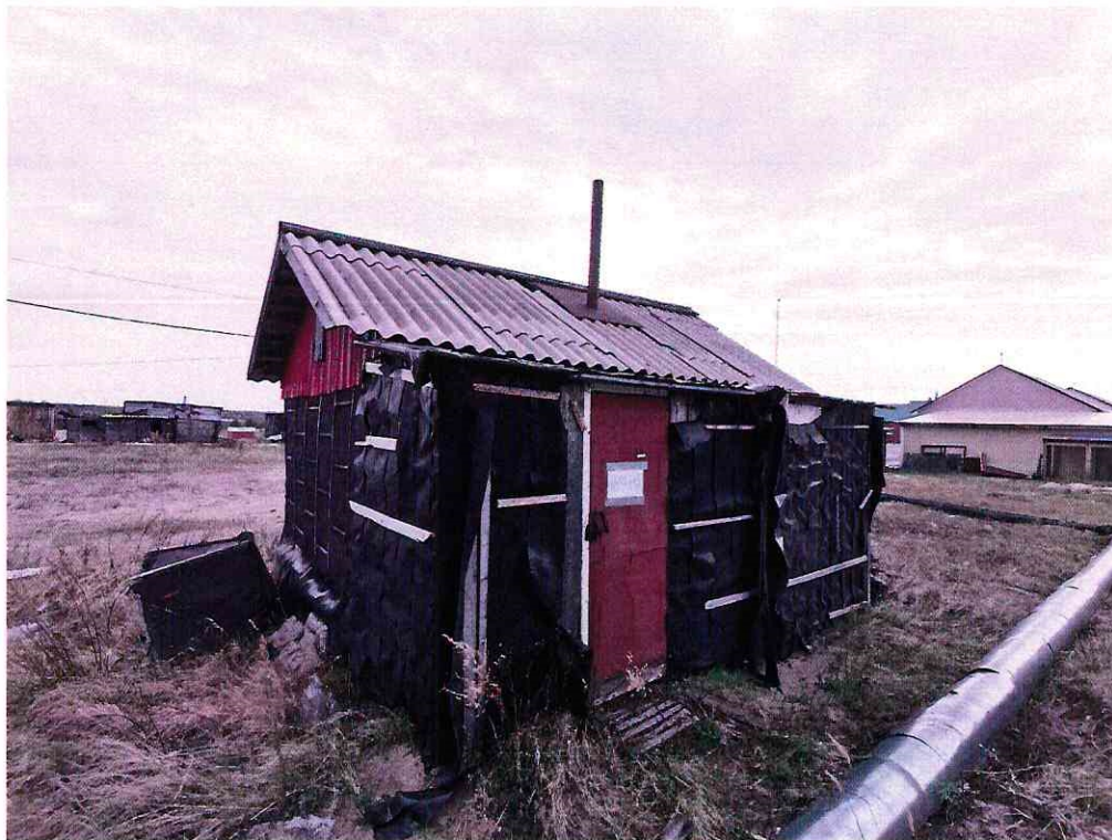
(Объект № 133 – деревянная баня.)